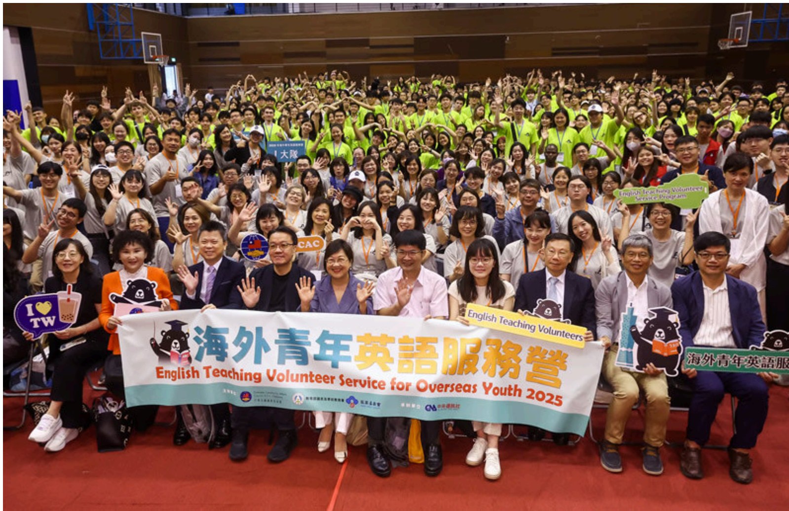
今年海外青年英語服務營