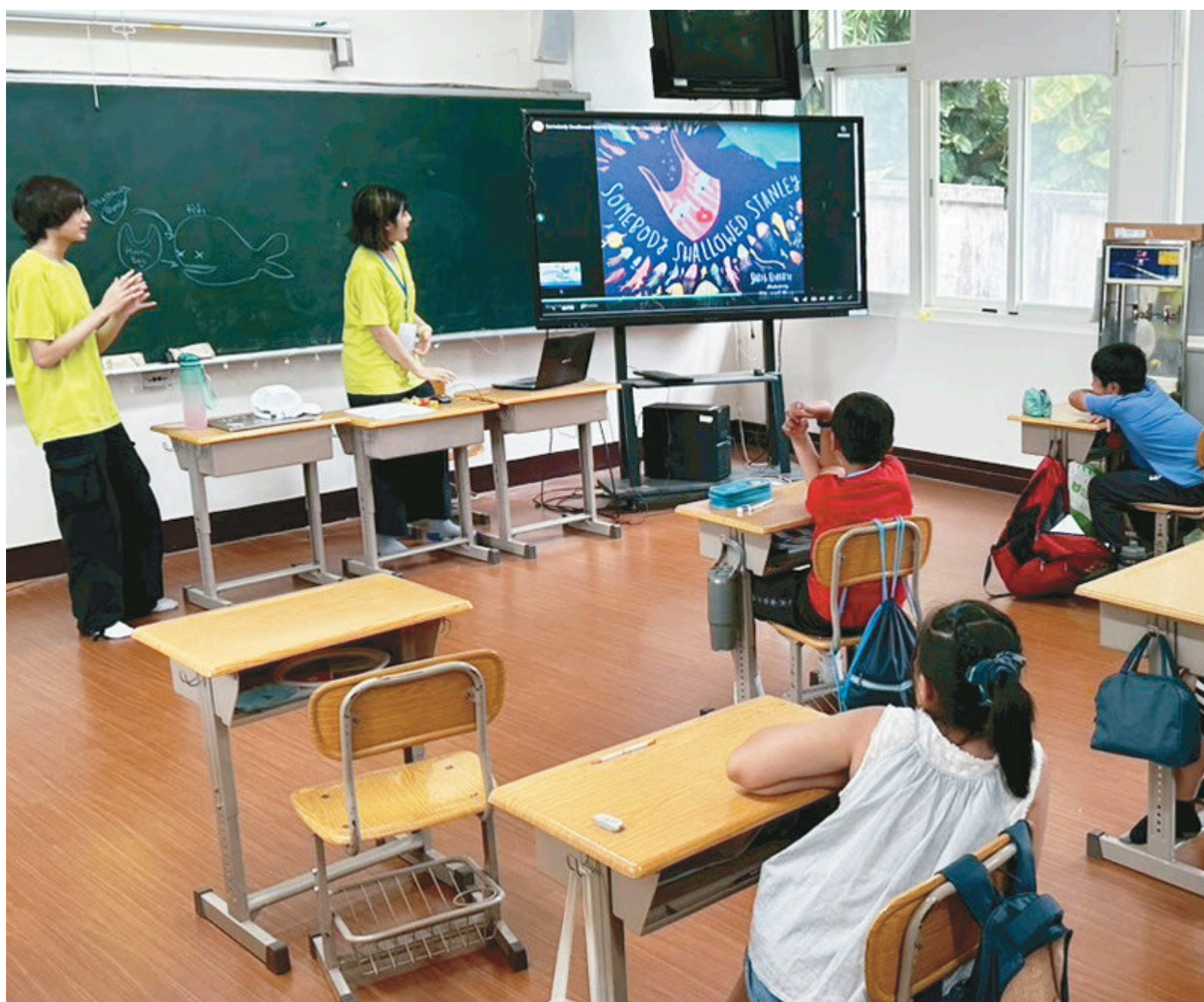
海外青年以生動活潑的方

英語服務營將持續擴大辦理，歡迎各縣市國中、國小踴躍向教育部國民及學前教育署、客家委員會及原住民族委員會申請，加入英語服務營的行列，提供臺灣學童更多學習英語、拓展國際視野與跨文化交流的機會。