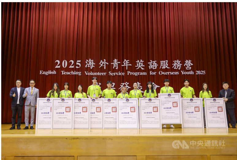
僑務委員會、教育部國民及學前教育署、客家委員會、苗栗縣政府共同主辦「海外青年英語服務營」，成果分享會31日在亞洲大學舉行，僑委會副委員長阮昭雄（左2）頒發服務證書給海外志工。114年7月31日