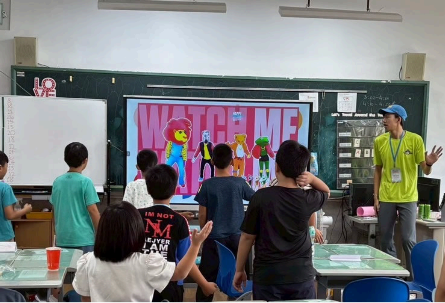
海外青年志工設計內容豐富的英語