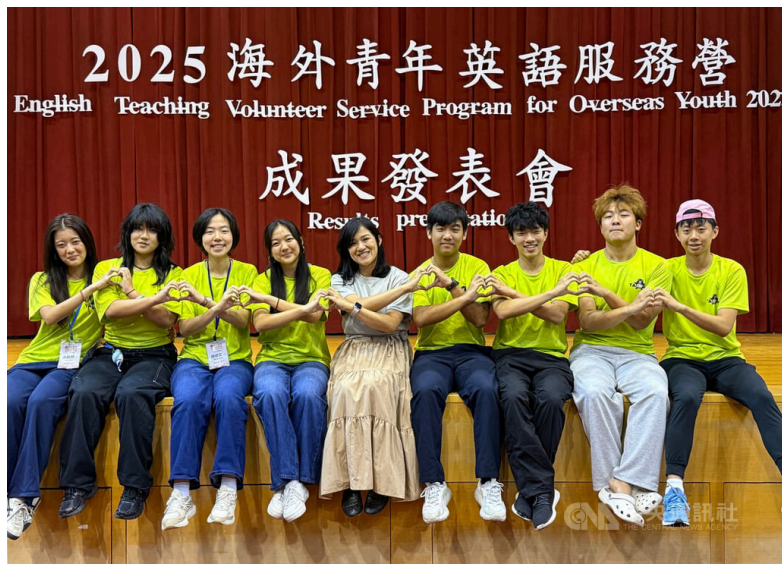
「海外青年英語服務營」今年共有409名海外青年志工完成英語服務教學任務，為學童開啟看見世界的窗，31日成果發表會上，志工開心合影留念。中央社記者蕭博陽台中市攝 114年7月31日

僑委會表示，海外青年英語服務營2006年創辦至今，促成超過7000名海外青年來台參與，服務逾5萬名中小學生，累積無數動人故事；透過英語教學與文化交流，海外志工深入台灣校園與社區，理解不同族群與文化，並與學生互動中建立起跨文化尊重與共感。（編輯：黃世雅）1140731