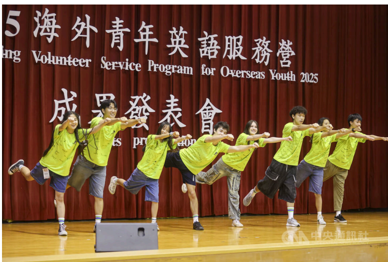
僑務委員會31日在亞洲大學體育館舉辦海外青年英語服務營成果發表會，今年有22個國家青年志工來到台灣，前往北、中、南、東及離島共68所國中、小學，展開為期2週英語教學服務。114年7月31日